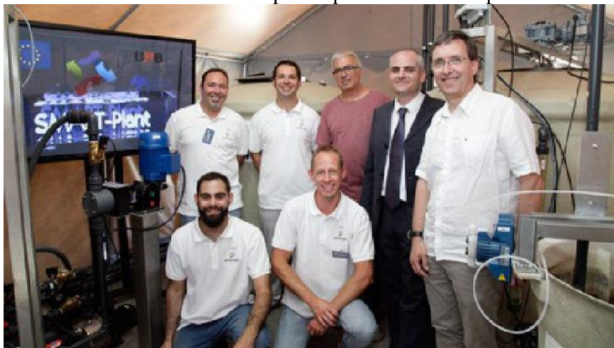
Grupo de investigación Genocov de la Universidad Autónoma de Barcelona.

Recuperaría parte de los residuos en materia prima para fabricar bioplásticos